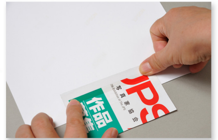
応募票をプリント裏にセロテープで貼ります。表から見て氏名が見えないように。