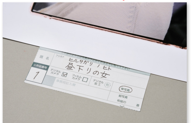
表から見て氏名が隠れた状態の応募票。