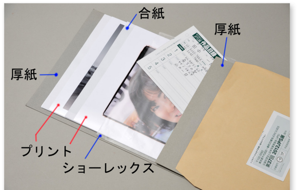
プリントにキズが付かないようにショーレックスなどに入れ厚紙ではさみ作品が折れないように保護します。作品目録も同封してください。