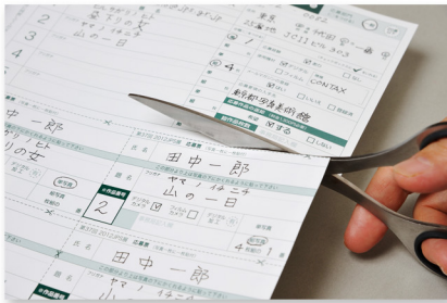
作品目録と応募票を切り離します。