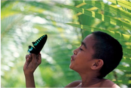
オオアカエトリバナエグハと少年

は薄れると思います。時間を超えて、その時代を伝える事のできる大切なメディアです。