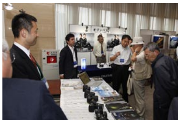
（株）ニコンイメージングジャパン