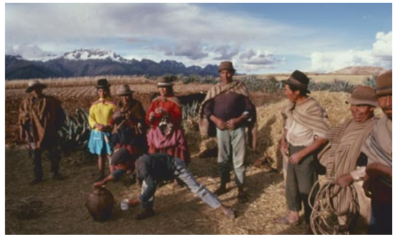
大地の神パチャママに酒をささげ豊作を祈るインカの末裔

それと、現像後の高揚感が違いますね。フィルムは日本に帰って、現像するまで半年はかかっていましたが、今は現場で見れてしまいます。いい面では、ISO感度の点ははずいぶん楽になりました。暗いところで撮影することが多かったですから、感度の違うフィルムを大量に持ち歩く必要も無くなりましたね。