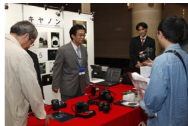
キヤノンマーケティングジャパン（株）