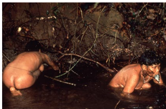
ヤノマミ (ベネズエラ) の手づかみ漁

田沼 写真の基本は記録だと考えています。デジタルの発展で写真のジャンルも多種多様になりました。しかし、写真の持つ記録性を大切にしていかないと社会との接点