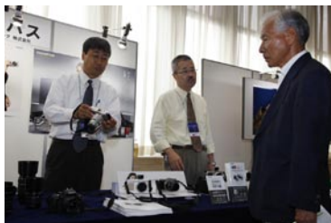
オリンパスイメージング（株）