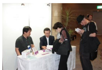
日本写真家協会のブース

の最新機材、技術展があり、各メーカーのブースでは、新製品を手にした来場者が熱心に見入り、担当者のこまやかな説明を聞きつつ活発な質問が飛び交っていました。