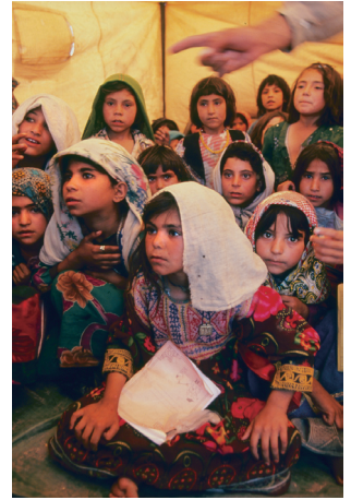
ヘラートの遊牧民キャンプ内テント教室で学ぶ女子生徒。アフガニスタン 2001年

水越 高山帯に棲むライチョウは個体数が激減しているため、今のうちにと思い、2年ほど前からデジタルでライチョウの再撮影を始めています。これが悔しいくらいに良く写る。これからは、デジタルの良さを生かしながら、フィルムでは撮れなかった生態にも挑戦していきたいと考えています。もちろんフィルムも続けますが。