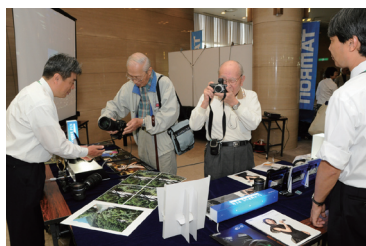
オリンパスイメージング(株)