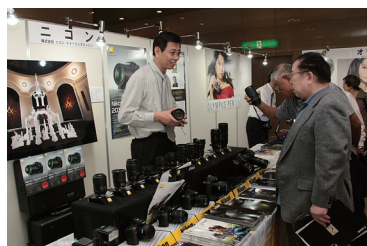
(株)ニコンイメージングジャパン