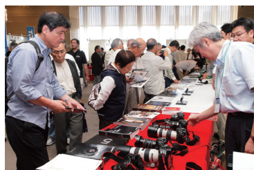
キヤノンマーケティングジャパン(株)