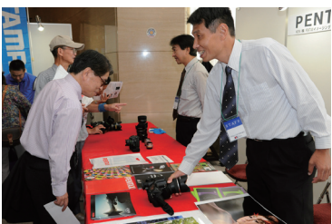
HOYA(株)PENTAX イメージング・システム事業部