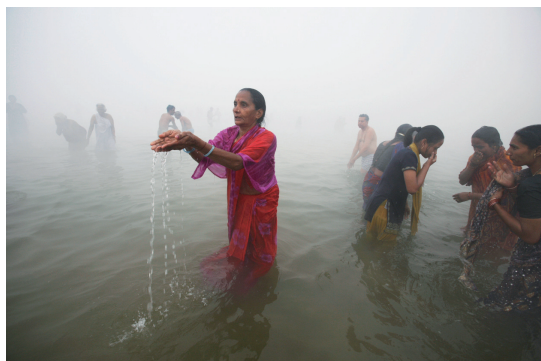
霧のなかの沐浴、インド、2007年