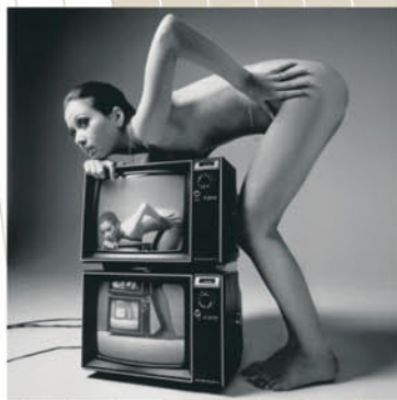
立木義浩 「イワたち」 (東京・1989)