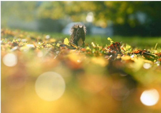
金賞 西山亜希子「光のファンタジア」5枚組