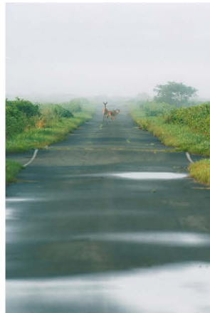
銀賞 中村和典「最果て」単写真