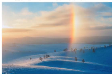
銅賞 マンダリンエミ「円弧が雪原を照らす」3枚組